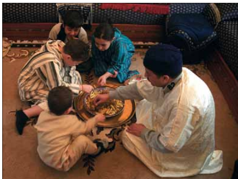
Een islamitische familie verbreekt een lange dag van vasten met de iftarmaaltijd.

Het gebruik van een felicitatiebrief werd gelanceerd door het Abrahamhuis in Genk. In Brussel