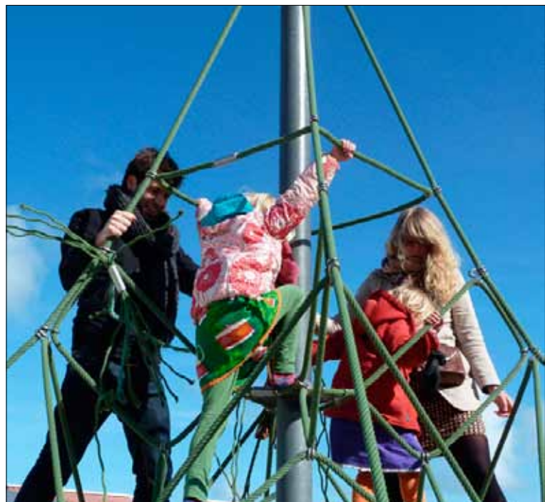
Velen proberen in het dagelijkse leven als gezin het geluk op het spoor te komen.