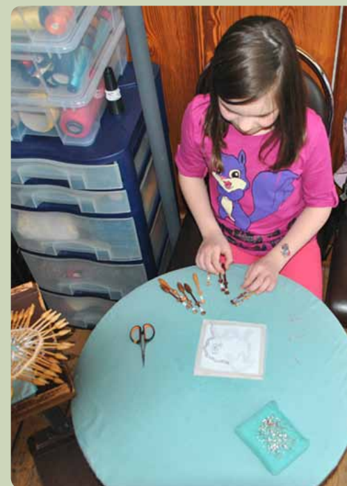
Jeugdige kantklossers houden een oude traditie in leven.

Straks sturen de kinderen hun mooiste werkje in voor een internationale wedstrijd. Benieuwd welke prijs ze nu weer in de wacht slepen. Maar eerst is het uitkijken naar de trip naar het modemuseum in Calais. Kantwerk kan immers ook heel modieus zijn.