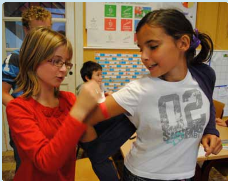
Water zuiveren en de armomtrek meten. Met teamwerk bereik je resultaat

Juf of meester kan de Meteorkoffer gratis ontlene bij Artsen Zonder Grenzen. Reserveren kan via www.azg.be of op 02 474 74 91.