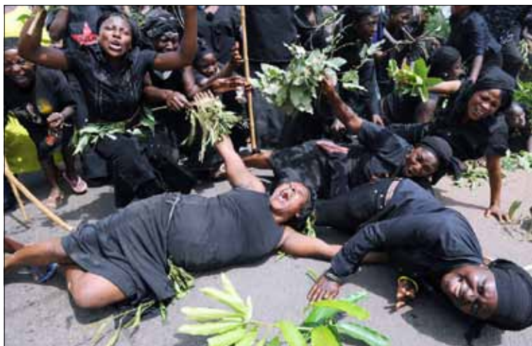
Slachtoffers van geweld uit het noorden van Nigeria protesteren emotioneel tegen de islamitische terreur.

De droom van Sarajevo als het 'Jeruzalem van het Westen', waar alle godsdiensten in vrede samenleven, lijkt definitief voorbij. De aartsbisschop van Sarajevo, mgr. Puljic, klaagt de feitelijke opdeling van Bosnië-Herzegovina aan en de systematische achterstelling van de katholieke minderheid in de regio. „Vandaag rest slechts een honderdtal joden, die net als de Servische en Kroatische minderheid slachtoffer zijn van een etnische zuivering, al wordt dat niet zo genoemd.” Volgens mgr. Puljic was vijftien procent van de 700.000 inwoners van Sarajevo vóór de burgeroorlog in 1992 katholiek. Vandaag leven er naar schatting amper nog 17.000 katholieken. (IVH)