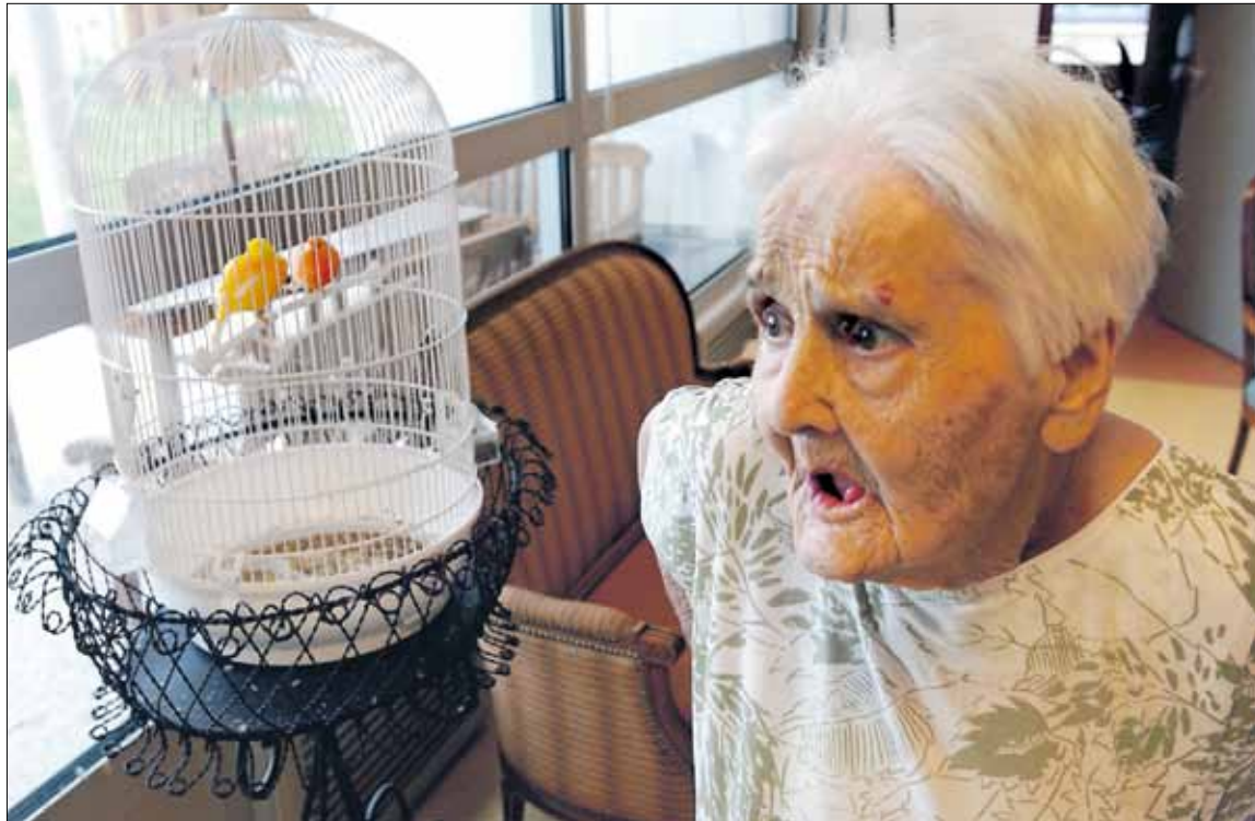
Zorgafhankelijkheid bij ouderen verhoogt het risico op misbruik.

Mishandeling kan vele vormen aannemen (zie artikel hiernaast). De Bethune: „Ouderen worden bestolen, in geld of in goederen, en er wordt misbruik gemaakt van hun goedgelovigheid. Bijna negentig procent van de plegers blijkt familie. Tot nog toe waren ze niet strafbaar. Ze konden enkel worden verplicht tot het betalen van een schadevergoeding. De nieuwe wet verandert dat. Ze kunnen nu voor de strafrechter worden gebracht.”