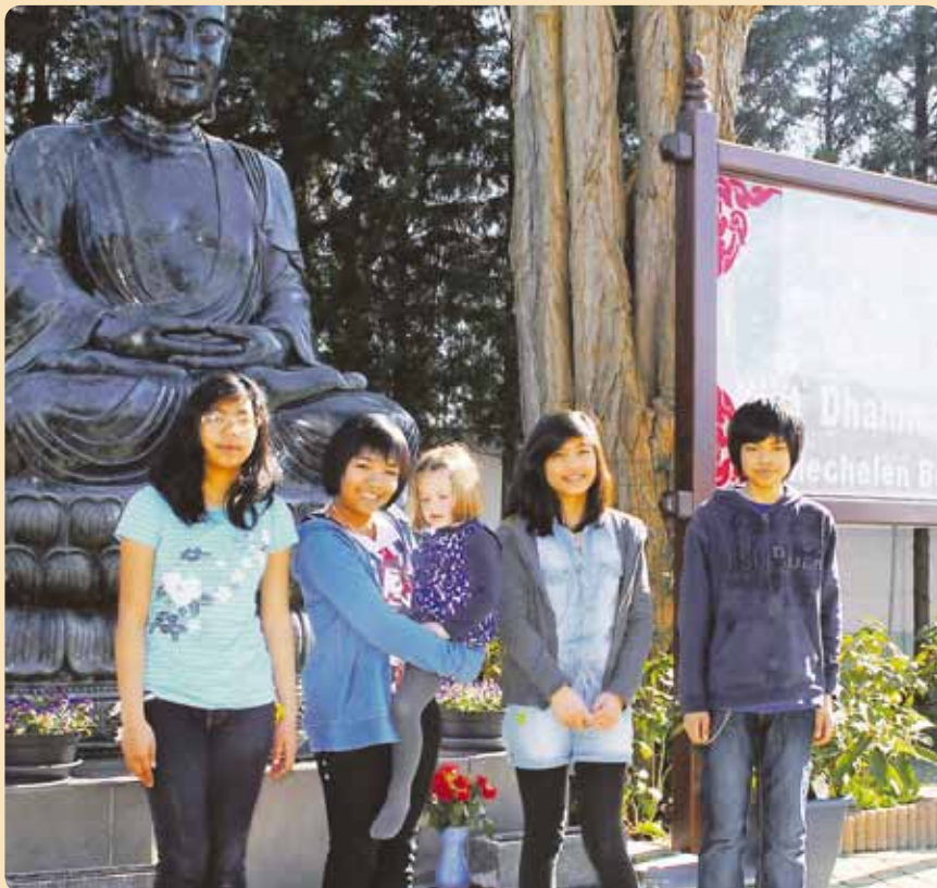
Soms brengen we een vriend(in) mee naar de tempel. Hier is iedereen welkom.

W e zijn op weg naar Pasen . Voor christenen is Pasen het feest van Jezus die ter dood gebracht wordt, maar op een nieuwe en misschien nog sterkere manier onder ons voortleeft . Het is het feest van de Liefde die de dood overwint. In dit verhaal van het evangelie horen we hoe Jezus zichzelf wegcijfert om zijn vriend Lazarus te redden. Zijn liefde doet echt wonderen . Ook jouw vriendschap kan mensen doen opstaan. Pas als mensen zo zorgen voor elkaar, wordt het straks echt een zalige Pasen .