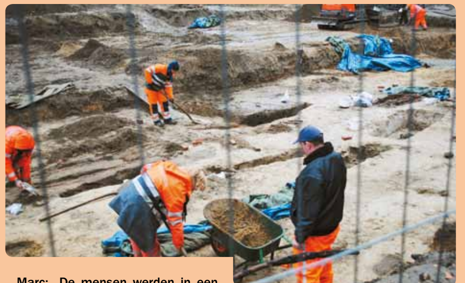
Het Sint-Romboutskerkhof herbergt schatten van onze voorouders.

Zeg van elk WEETJE over MECHELEN of het JUUST OF FOUT is. Kleur telkens het juiste vak. KLAAR? Lees van onder naar boven. EN?