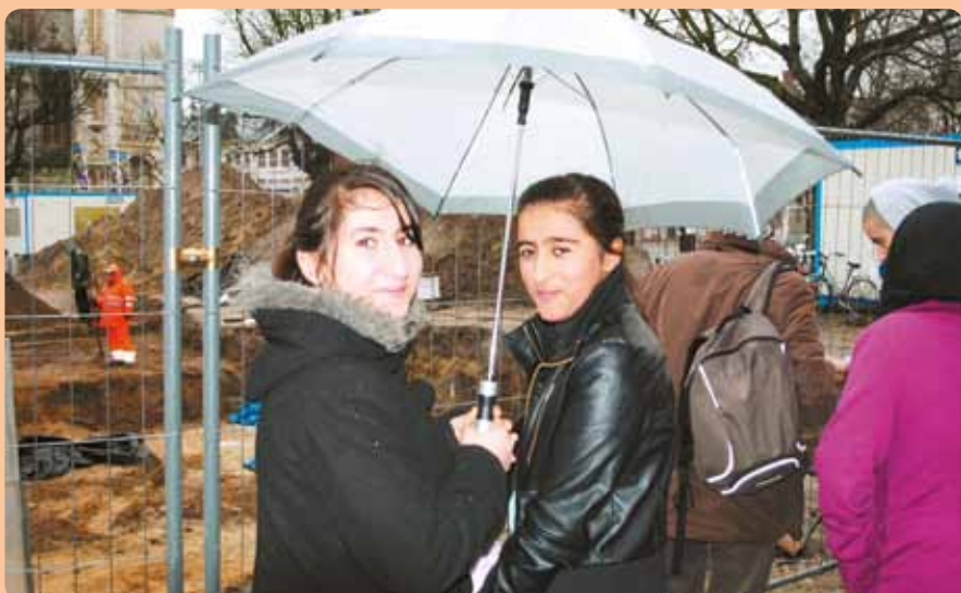
„Gelukkig moeten wij niet helpen graven in deze winterse buien.”