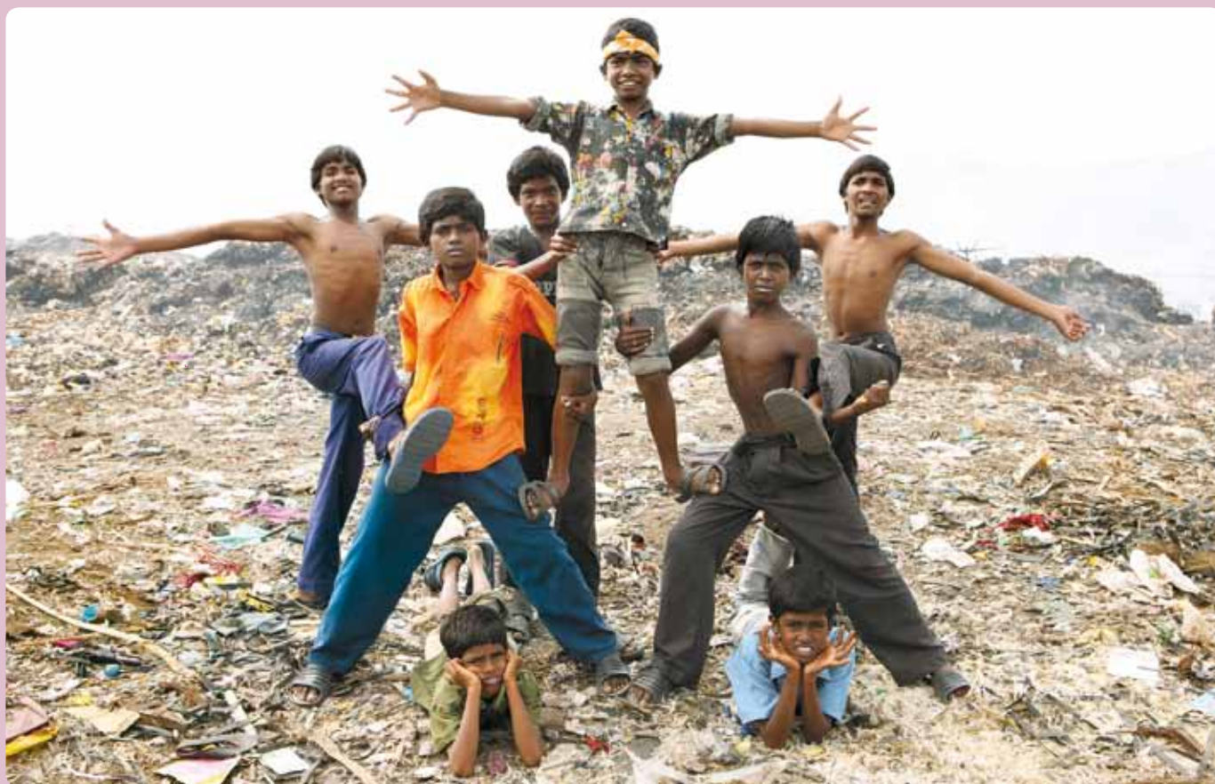
De jongens zingen en dansen hun levensvreugde uit op de vuilnisbelt. Als echte helden.

Het evangelie lijkt vandaag wel op een nieuwjaarsbrief , met acht wensen . Allemaal draaien ze om 'gelukkig zijn'. Jezus somt dingen op die je niet kopen kunt, geen mooie auto of nieuwe gsm. Gelukkig ben je als je rechtvaardig en eerlijk bent, als je aan vrede werkt en je niet vlug boos maakt. Dan maak je ook anderen gelukkig. Waar jij komt, zal de wereld er dan veel mooier uitzien... de hemel op aarde!