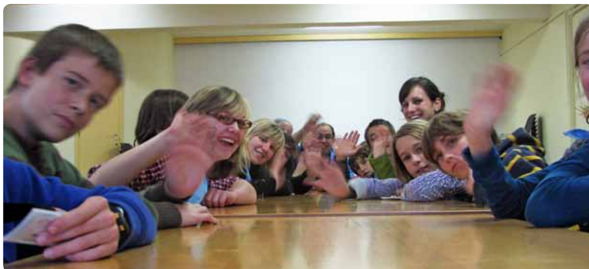
Tijd voor een babbel tussen spel, tocht en gebed.