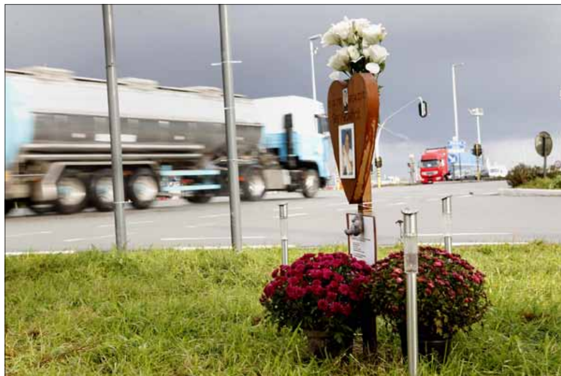
Verkeersslachtoffers almaar vaker herdacht op straat, hier Kennedylaan, Gent.

Rosseels ziet ook beperkingen bij het afscheid nemen bij een herdenkingsplek in de publieke ruimte. „Op een kerkhof word je gedragen door de collectiviteit en een sacrale sfeer. Je bent er zelden alleen met je tranen. Begraafplaatsen zijn ook vaak groen en rustgevend ingericht in tegenstelling tot vele herdenkingsplekken langs een drukke baan. Tussen het verkeer dat doorraast, kun je je erg eenzaam voelen.”