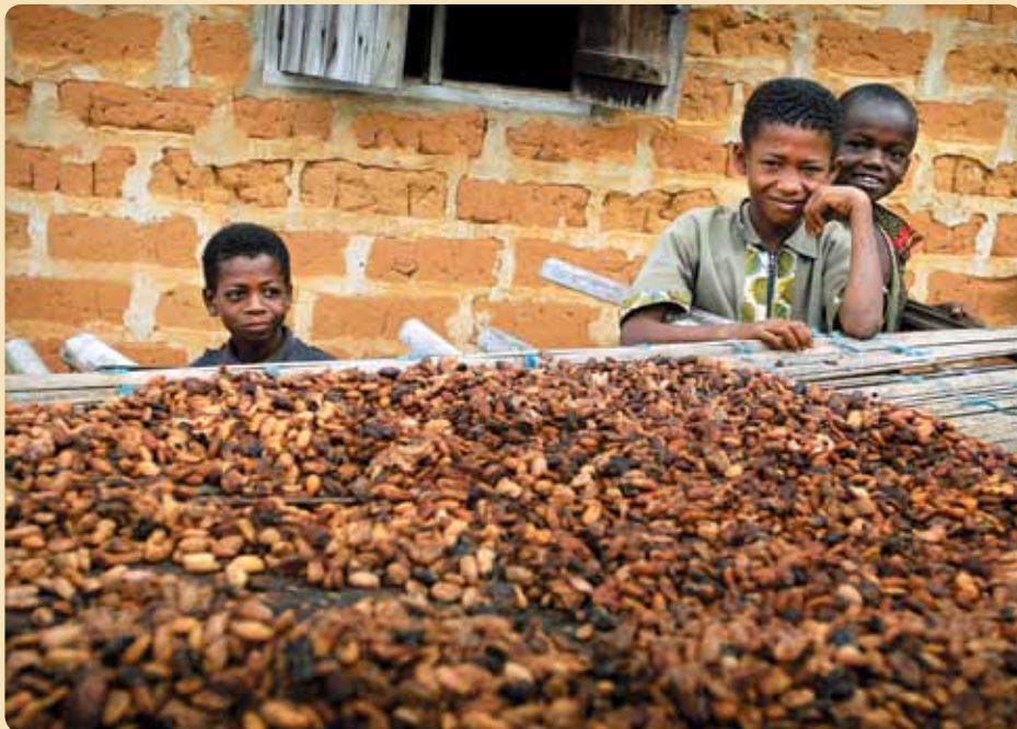
Waarvoor zouden al die cacao bonen toch dienen, vragen deze jongens uit Ivoorkust zich af.