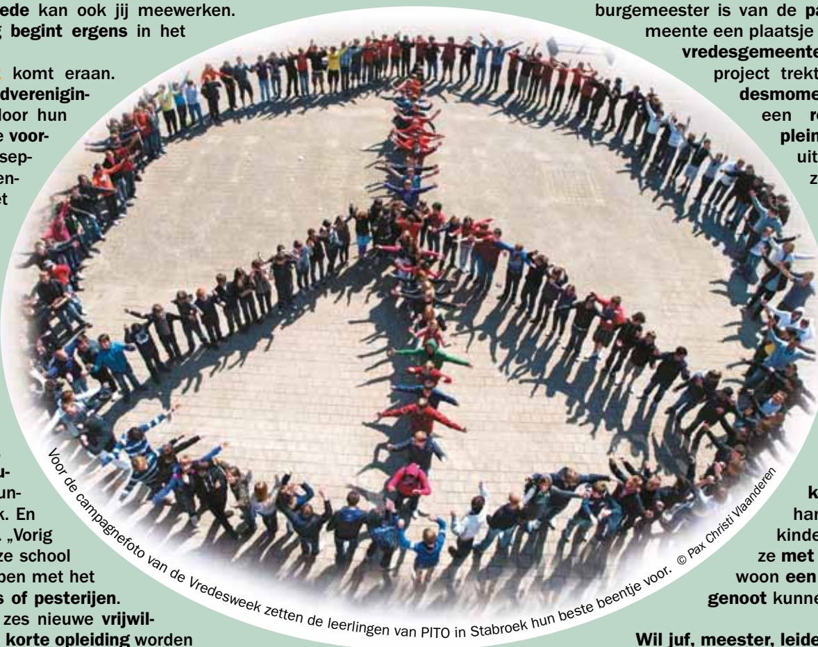
Voor de campagnefoto van de Vredesweek zetten de leerlingen van PITO in Stabroek hun beste beentje voor.