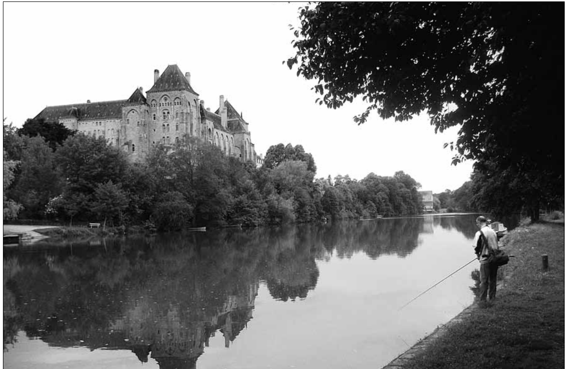
Het imposante hoofdgebouw van de abdij weerspiegelt in de rivier Sarthe.

Wie in Solesmes binnentreedt, moet fysiek in staat zijn de zeven gebedsmomenten te zingen, en die af te wisselen met een leven van studie en arbeid. Je moet ook Latijn leren, want alle diensten en gebeden, op de mislezingen na, gebeuren in het Latijn.