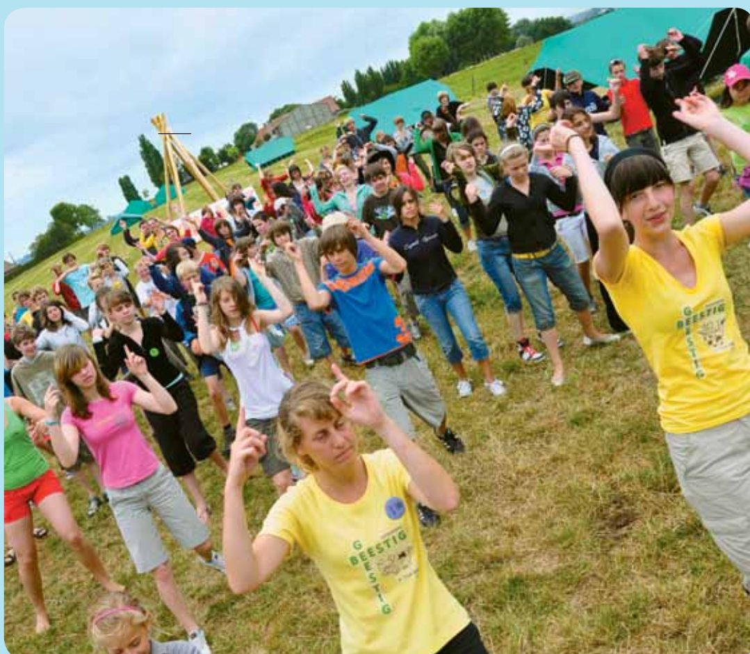
Een bijbels tentenkamp heeft net dat ietsje meer.

Naar Lucas 10, 1-12. 17-20 Veertiende zondag door het jaar C