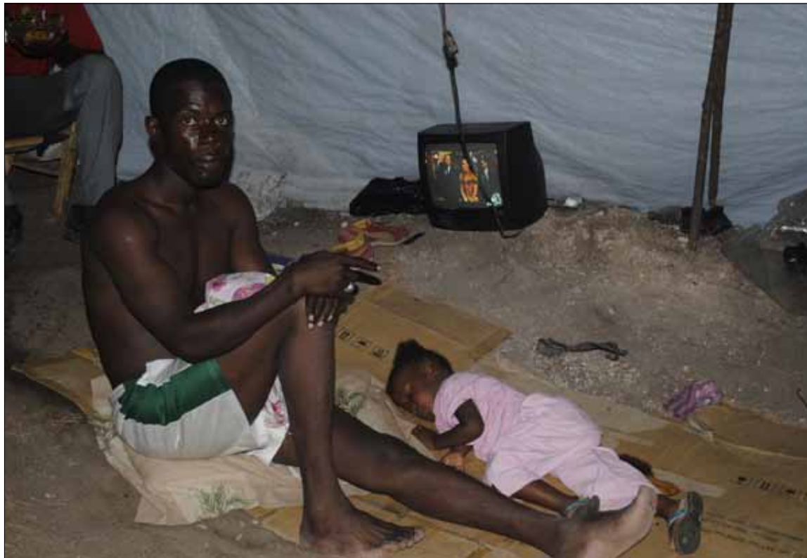
Tienduizenden Haïtianen verblijven nog steeds in tentenkampen.