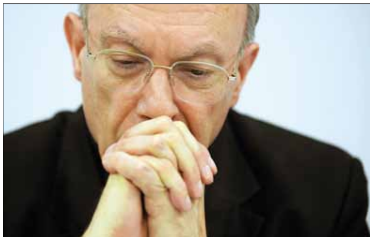
De aartsbisschop van Mechelen-Brussel wil uitzuivering.

Volgens mgr. Léonard houdt de crisis een uitnodiging in om ons bewust te worden van de werkelijkheid van de zonde in ons le-