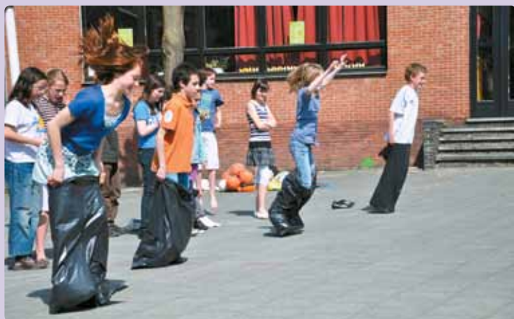
In een estafettespel toonden we ons sportief als groep.

INGEWIKKELDE WOORDEN , die Jezus vandaag spreekt. Hij bidt tot zijn Vader, net voor Hij gevangen wordt genomen. Jezus vraagt aan God om alle mensen op te nemen in zijn liefde. „Laat hen allen één zijn”, zegt Hij. De toekomst van de leerlingen is Jezus grootste zorg. Want hoe moeten wij andere mensen overtuigen van Gods liefde als we zelf verdeeld zijn en ruzie maken? Eén worden kan alleen als er genoeg liefde is tussen mensen. We moeten er samen voor gaan en iedereen laten meedoen. Zo gaat het toch ook in de voetbalclub of de dansschool. Iedereen draagt zijn pasje bij. En samen vorm je één mooi geheel.