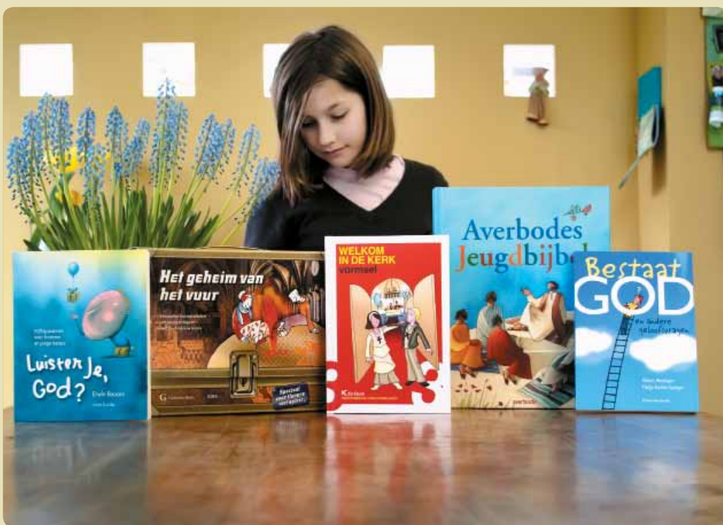
Geloven is een vuurtje in je hart. Een mooi boek kan helpen het vuur brandend te houden.

Waarom vergelijkt Jezus de mensen die in Hem geloven met schapen? Dan denken we vaak aan mensen met een 'kuddegeest', die volgen zonder nadenken. Daarover gaat het natuurlijk niet. Het gaat erom dat Jezus onze herder wil zijn. Of we Hem volgen, dat moeten we zelf beslissen. Hopelijk denken we daar goed over na. Want alleen dan kun je in alle vrijheid 'ja' zeggen. Jezus kent zijn volgelingen bij hun naam. Ieder is uniek voor Hem. Met heel eigen talenten en tekorten. Ken jij nog andere mensen die voor jou een goede herder zijn? Mensen die je de richting wijzen en jou bij naam noemen?