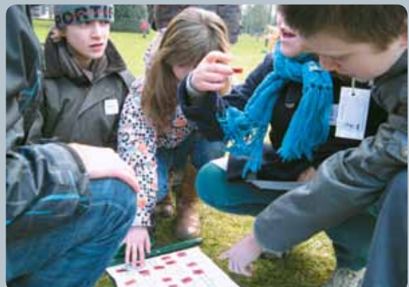
De vormelingen puzzelen in het park.

'H et verhaal van Bavo en de symbolen die zijn bekering uitdrukken, deden ons nadenken over onszelf. Een stenen hart werd een warm hart , een zwaard werd een kruis , een valk een duif en een gouden kroon werd een eenvoudige kroon . Wat betekenen deze symbolen in mijn leven? Wat is de betekenis van mijn vormsel ? Hoe kan ik een 'nieuwe' mens worden door mijn vormsel? We zongen zo goed mee dat we nog altijd hees zijn. Ook het puzzelen in het park vonden we heel fijn. Maar het slotmoment was het toppunt van de dag: van elke groep mocht iemand verkleed als Bavo de catwalk op. Het was een onvergetelijke dag, waar we nog lang zullen aan denken.