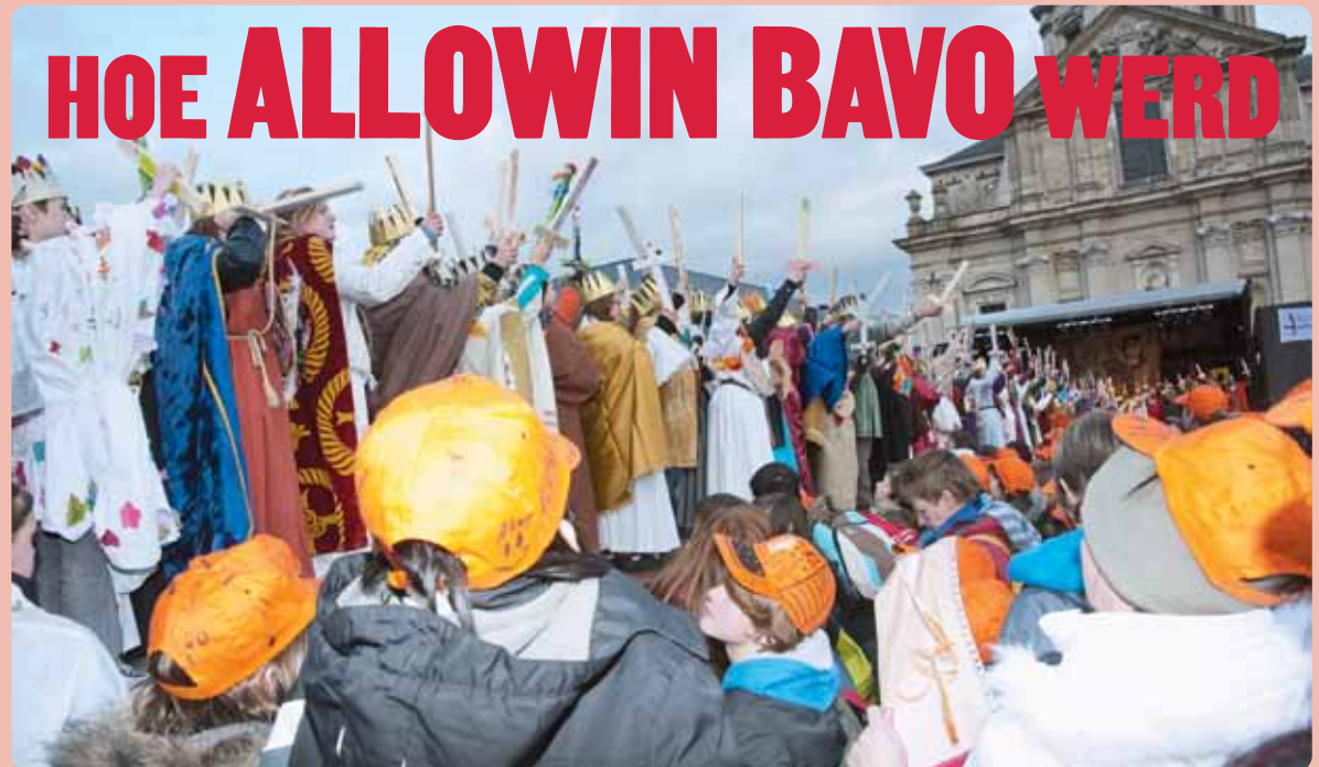
180 Bavo's op het podium.

Z olang er maar mensen zijn die ons met open armen ontvangen, is er altijd een weg terug. Maar vergeven en vergeten is niet altijd makkelijk. Vooral niet als broer of zus beloond wordt voor iets wat jij altijd doet zonder morren . Een dubbele taak in deze veertigdagentijd : blij zijn als iemand anders iets krijgt en jij niet, en niet kwaad blijven op wie jou iets misdeed. Kijk nog eens naar het evangelie. De oudste zoon heeft het over 'die zoon van jou' . En de vader antwoordt met: 'die broer van jou' . Wat leer je hieruit?