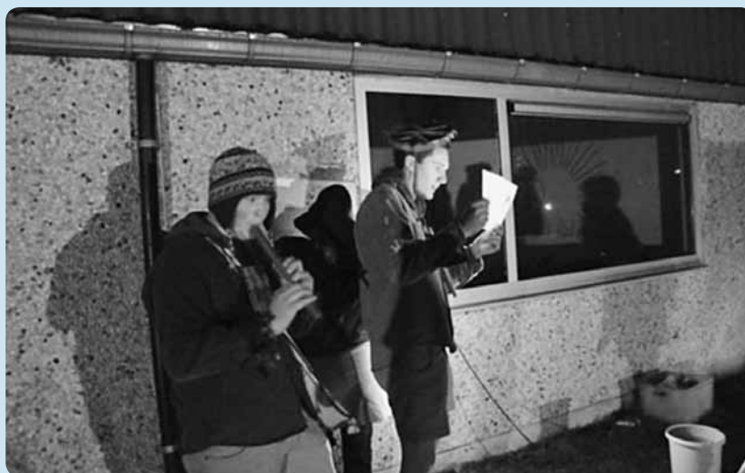
Chiro Waregem kruipt in de huid van de Boliviaanse bergbewoners.

zelf iets op. Je voelt de noodzaak om zelf in actie te schieten en de handen in elkaar te slaan. Het is een ideaal spel als je op een speelse, leuke manier toch iets leerrijks wil doen. Een goeie voorbereiding is noodzakelijk, maar het loont zeker de moeite . Ideaal ook voor een boeiende namiddag op kamp!”