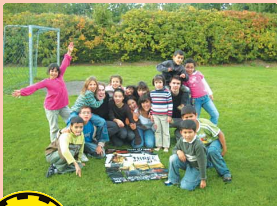
Leuvense studenten spelen met kinderen.