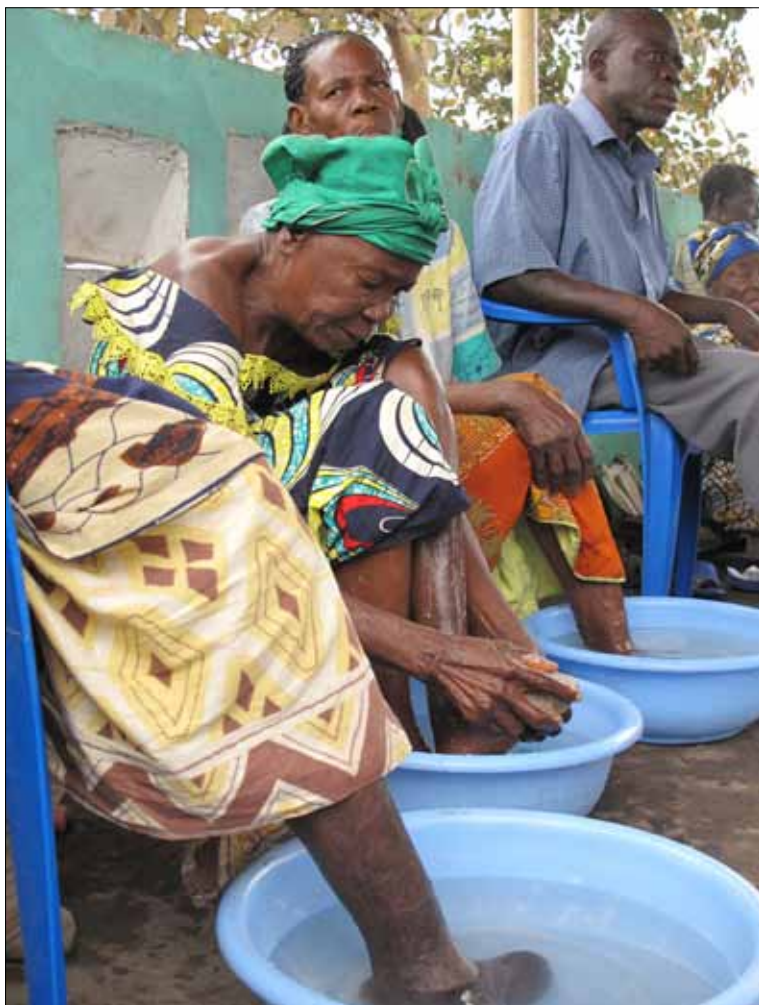
Melaatsen verzorgen zelf hun wonden. Levensnoodzakelijk, maar ook sociaal ontzettend belangrijk.

Buiten, op een met golfplaat overdekt en ommuurd terras met zicht op de majestueuze Congo-stroom, weken veertien mannen en vrouwen gezamenlijk hun door lepra verminkte ledematen. Het terras vormt met het schooltje, ooit van de zusters van het