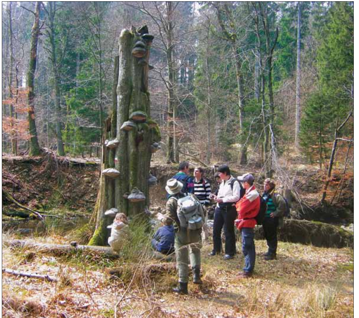
Elke week trekken de leden van +23 er in een andere provincie op uit, voor een wandeling, stadsbezoek, spel of fietstocht. „Je wandelt samen, en dan zie je wel of er iets uit de bus komt.”

Ze gaan op stap, genieten van sport, cultuur en spiritualiteit, en zijn vooral open en familiaal. +23 is geen huwelijksbureau, en toch zorgde het simpele recept van deze christelijk geïnspireerde vereniging voor singles al voor meer dan vijftig stellen en een veelvoud aan vriendschappen.