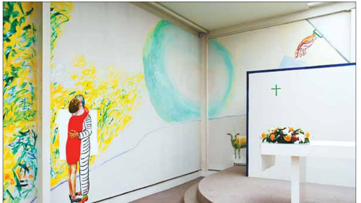
Taferelen uit het leven gegrepen in combinatie met uitgesproken christelijke symboliek. Ziedaar hét kenmerk van Roger Raveels kapel in Machelen-aan-de-Leie.

Na talrijke gesprekken weet de priester de meester over de streep te krijgen. Hij wil het project wel op zijn manier realiseren. Als thema kiest hij De religie van het leven . Raveel wil dat zowel gelovigen als ongelovigen er iets zouden aan hebben. De schilder noemt het