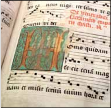
Het handschrift uit het Turnhoutse Begijnhofmuseum bevat naast muziek ook enkele miniaturen.