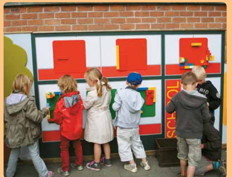
Dankzij de leerlingen van het VTI hebben de kleuters een prachtige speelmuur.