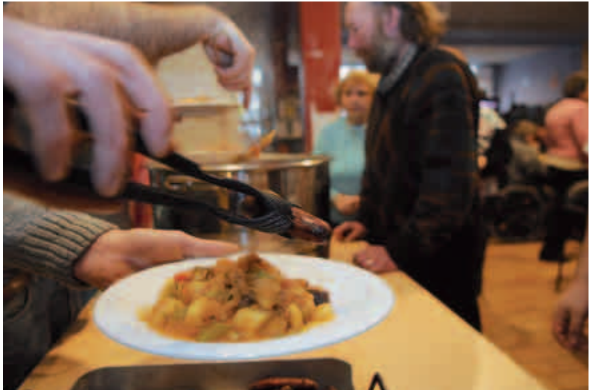
Gezond koken, opdienen en afwassen. In de Pigmentkeuken doen kansarmen alles zelf.

„Armoede schaadt de gezondheid”, stelt Welzijnszorg onomwonden. Pigment vzw verenigt kansarmen en verse groenten om daar iets aan te doen.