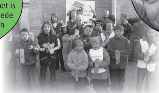
Misdienaars en kinderen uit Peer trekken al kleppend rond met houten muziekinstrumenten

Hallo, ik ben misdienaar in Wervik. Ik doe het heel graag. Soms loopt er wel eens iets mis en vergeet ik de kleine belletjes te laten luiden na het Heilig. Enkele weken geleden heb ik voor het eerst de wierook gedaan. Bah dat stinkt, maar het is wel héél leuk! Wij misdienaars hebben een heel goede band met elkaar. Onlangs zijn we gaan zwemmen en bowlen. Deze zomer gaan we met 2000 acolieten uit het bisdom naar Bellewaerde.