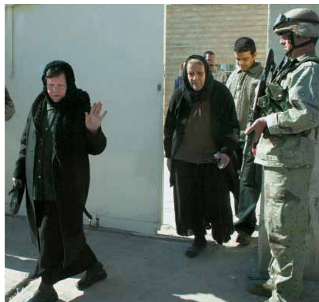
Iraakse soldaten bewaken een kerk in Bagdad.

ten en het islamisme aan te waken via steun aan Hezbollah. Vandaag vormen de christenen niet langer de meerderheid in Libanon. De vorming van een stabiele regering wordt problematisch.