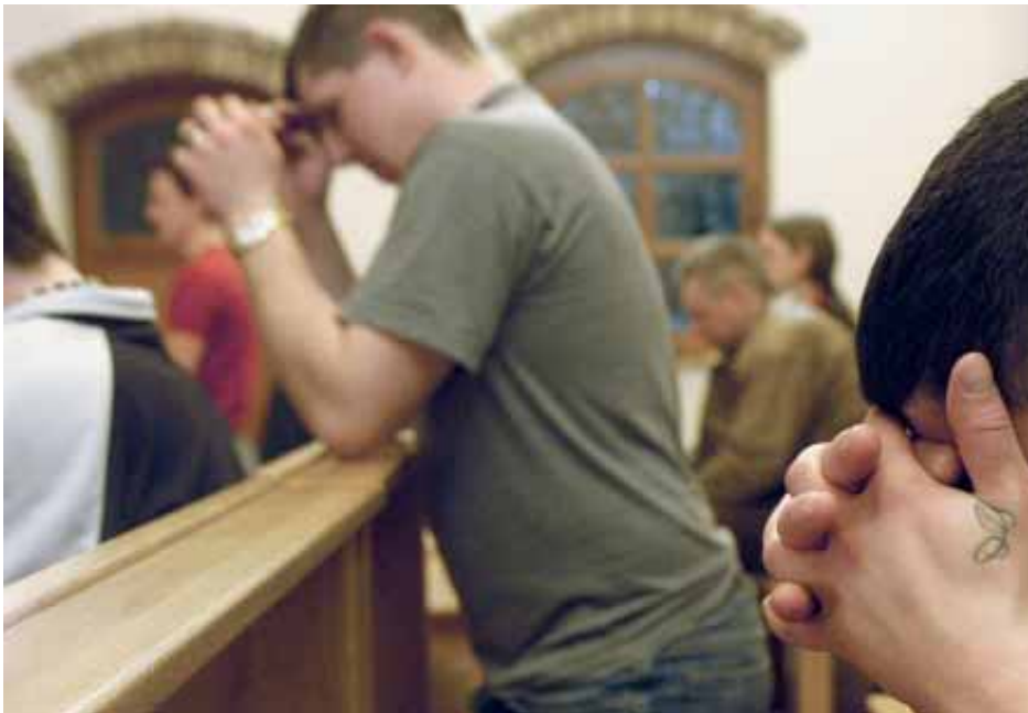
Plotseling niet meer kunnen bidden. Wat achteruitgang lijkt, is in feite een vooruitgang.

belbare en onnoembare verlangens spreken des te duidelijker. De woestijntrekker staat bloot aan bekoringen van alle slag. Was dit niet altijd de opzet van elke woestijnervaring, door God zelf zo bedoeld? In de Bijbel wordt te ge-