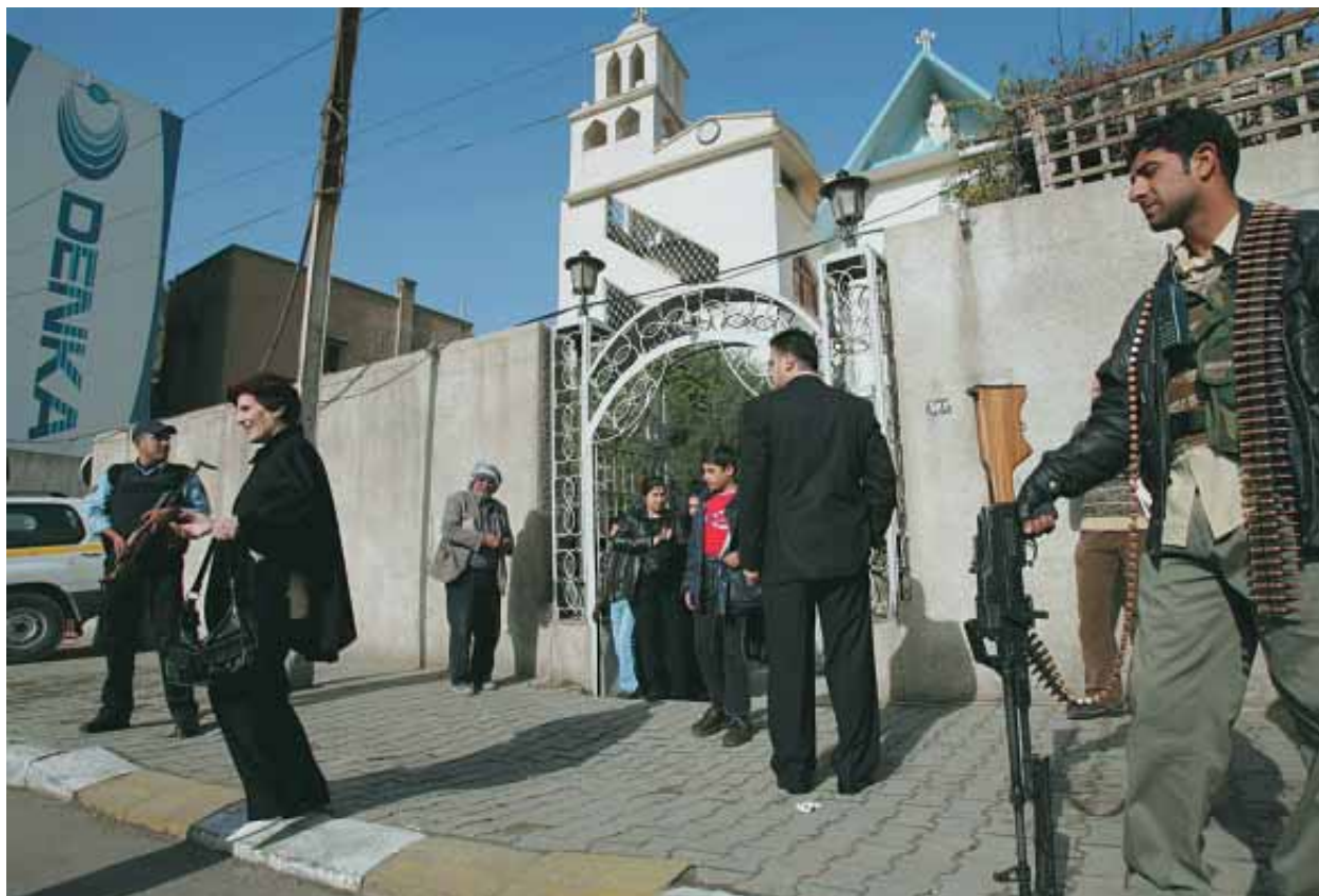
Lees verder op bladzijde 8

„Saddam verplichtte de christelijke groepen samen te werken. En dat lukte. De hulp die nu door de Kerk wordt geboden geldt voor alle christenen. De samenwerking komt ook voort uit een oecumenische sfeer; uit een nieuw verstaan van wat Kerk is. Ikzelf heb bijvoorbeeld in alle confessies goede vrienden.”