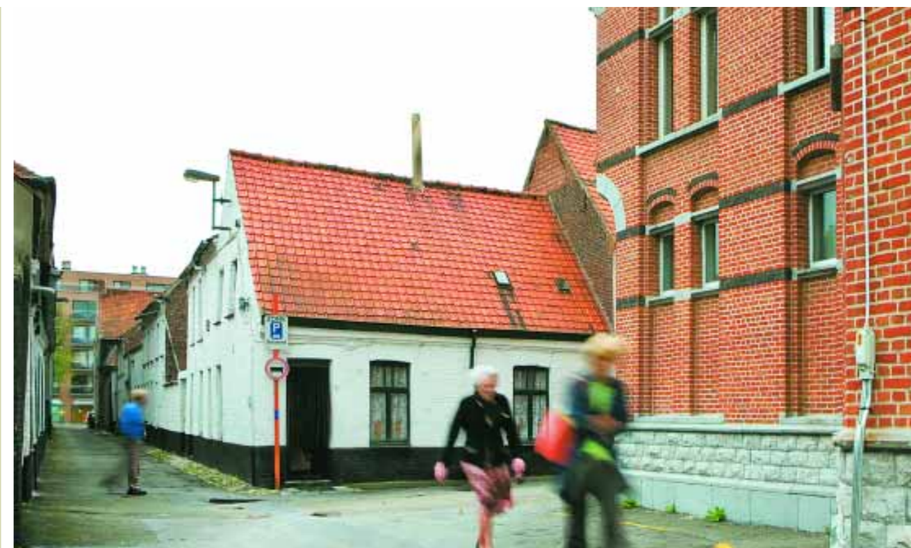
In Deinze kijkt het klooster van de zusters van Vincentius uit op arbeiderswoningen naast een oude textielabriek.

Een bewegwijzerde fietsroute van zo'n elf kilometer werd speciaal uitgewerkt en is wellicht de meest aangewezen formule, als u zich wilt laten verleiden door de kronkelende Leie. Huurfietsen zijn aan het vertrekpunt voorzien. Maar ook te voet of met de wagen is het parcours - of althans een deel ervan - doenbaar. Met vragen kunt u terecht op de stedelijke cultuurdienst, telefoon 09/381.95.12 of via e-mail cultuur@deinze.be .